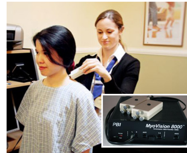
Der schmerzlose und strahlenfreie Hightech-Scan ermittelt gezielt bestehende Blockaden des Nervensystems

Auf Basis der Testergebnisse kann der Chiropraktiker eine zuverlässige Diagnose stellen und für jeden Patienten einen individuellen, höchst effektiven Behandlungsplan entwickeln.